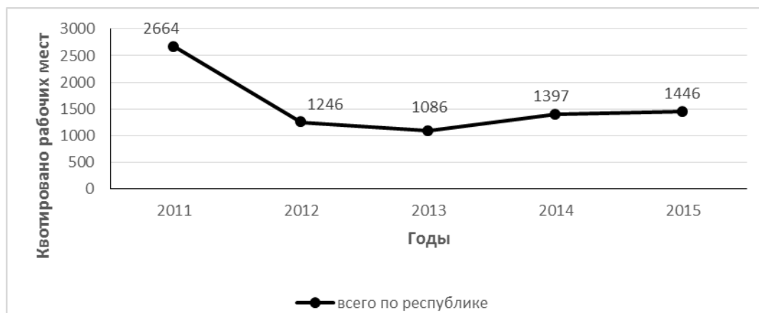
Рис. 1. Динамика количества заквотированных рабочих мест для инвалидов

постановление «О квотировании рабочих мест для трудоустройства инвалидов в организациях, зарегистрированных на территории Республики Марий Эл» [6]. На 2015 г. были определены 746 работодателей, осуществляющих свою деятельность на территории Республики Марий Эл, где установлена квота на 1397 рабочих мест. По состоянию на 1 июля 2015 г. работодателями заквотировано 1446 рабочих мест, что на 43 рабочих места больше установленной квоты (рис. 1).